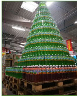
Partners in 60 countries