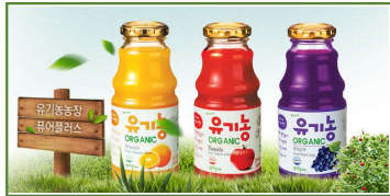
We Know Organic