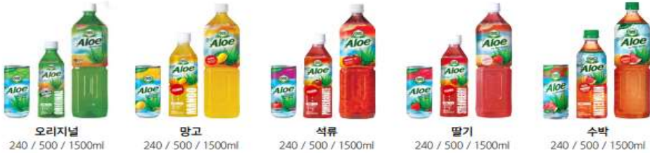
오리지널 240 / 500 / 1500ml 망고 240 / 500 / 1500ml 석류 240 / 500 / 1500ml 딸기 240 / 500 / 1500ml 수박 240 / 500 / 1500ml