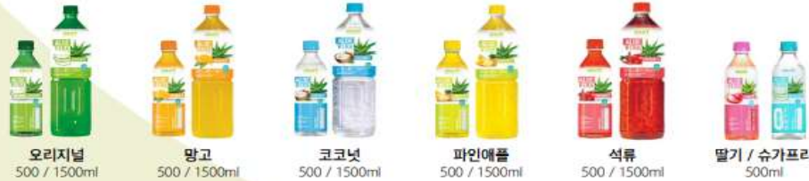
오리지널 500 / 1500ml 망고 500 / 1500ml 코코넛 500 / 1500ml 파인애플 500 / 1500ml 석류 500 / 1500ml 딸기 / 슈가프리 500ml