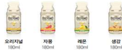
오리지널 180ml 자몽 180ml 레몬 180ml 생강 180ml