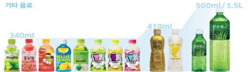
플모히도 레몬 / 자몽 / 애플망고 스타일리쉬 블루레몬 상큼함이 가득 알로에 스웨그 모히토 / 알로에키위 / 애플망고