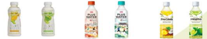
알로에워터 칼라만시 & 레몬 500ml 알로에워터 오이 & 사과 500ml 플러스워터 포도 500ml 플러스워터 복숭아 500ml 피나콜라다 500ml 모히토 500ml