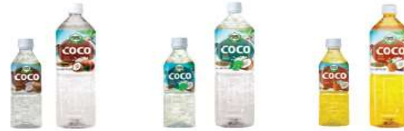
코코 오리지널 500 / 1500ml 코코 포도 500 / 1500ml 코코 파인애플 500 / 1500ml