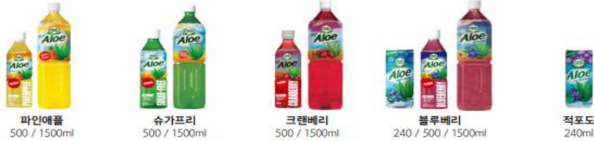
파인애플 500 / 1500ml 슈가프리 500 / 1500ml 크랜베리 500 / 1500ml 블루베리 240 / 500 / 1500ml 적포도 240ml