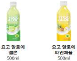
요고 알로에 멜론 500ml 요고 알로에 파인애플 500ml